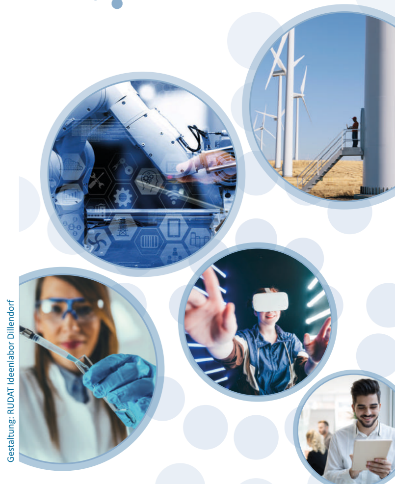
Gestaltung: RUDAT Ideenlabor Dillendorf