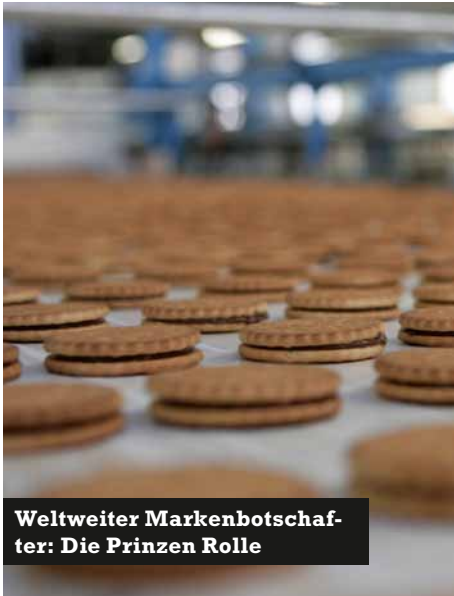
Weltweiter Markenbotschafter: Die Prinzen Rolle